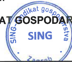
Jasna Pipunić, predsjednica